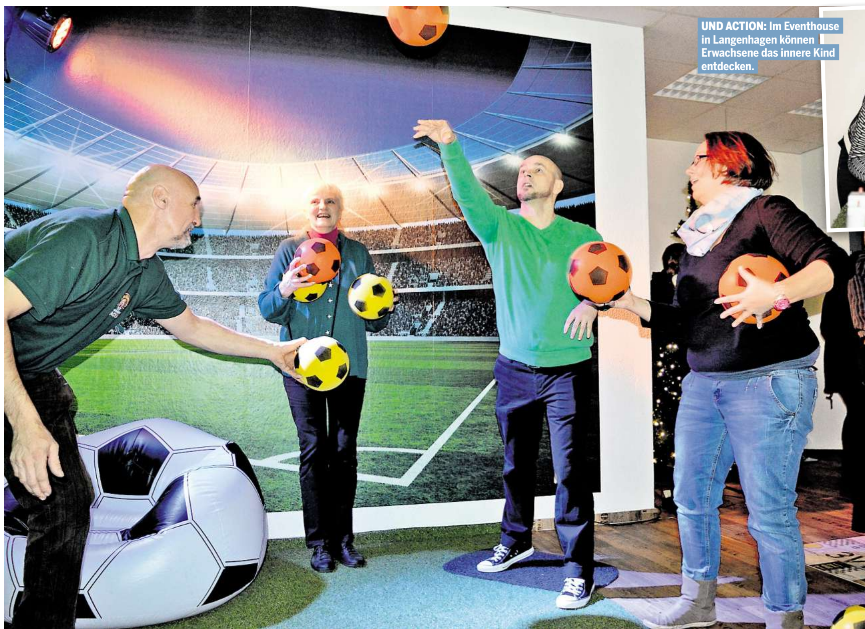
UND ACTION: Im Eventhouse in Langenhagen können Erwachsene das innere Kind entdecken.